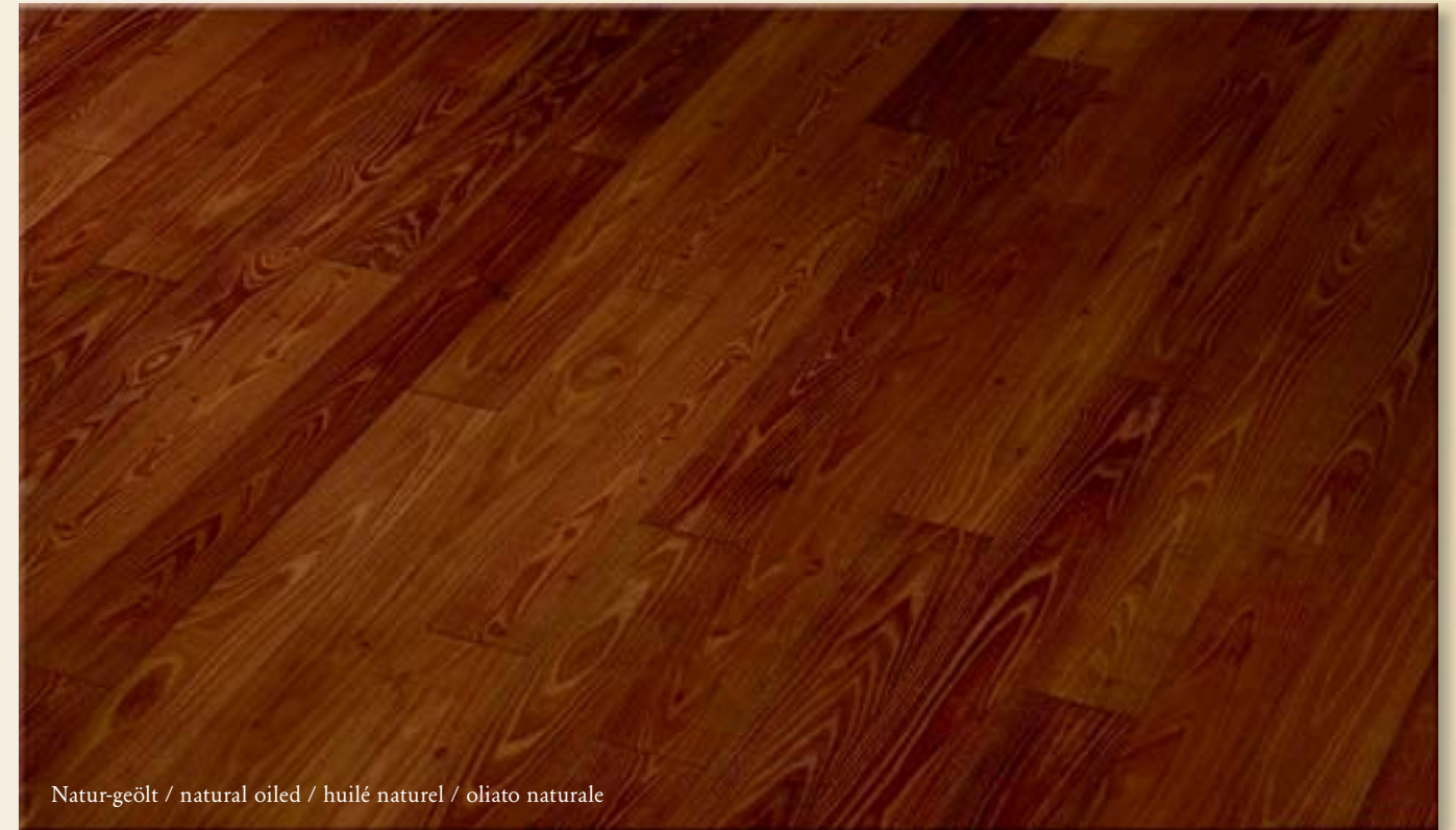
Natur-geölt / natural oiled / huilé naturel / oliato naturale

Finitura: oliata naturale / oliata UV / verniciata opaco