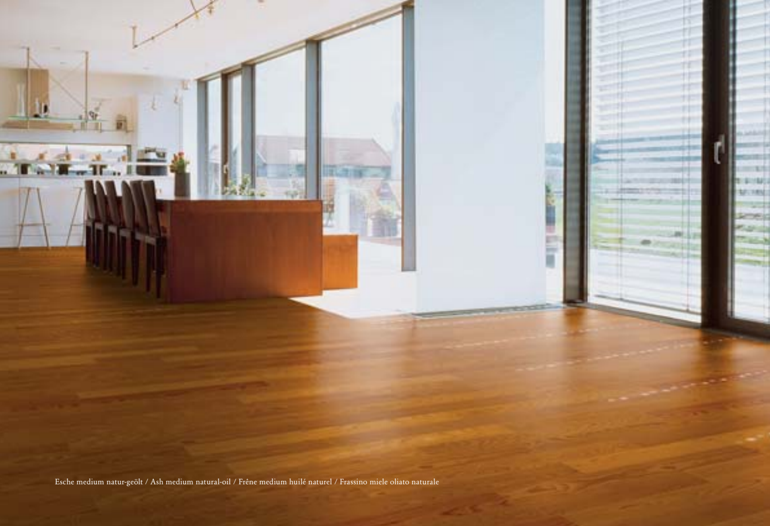
Esche medium natur-geölt / Ash medium natural-oil / Frêne medium huilé naturel / Frassino miele oliato naturale