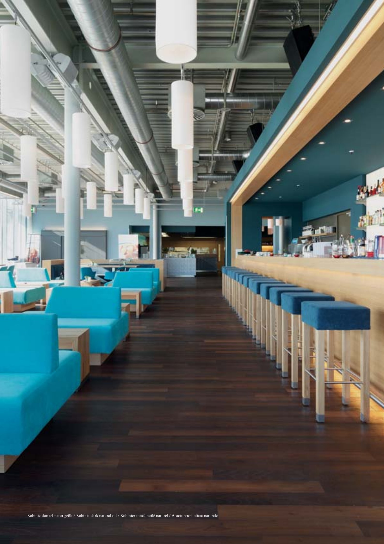
Robinie dunkel natur-geölt / Robinia dark natural-oil / Robinier foncé huilé naturel / Acacia scura oliata naturale