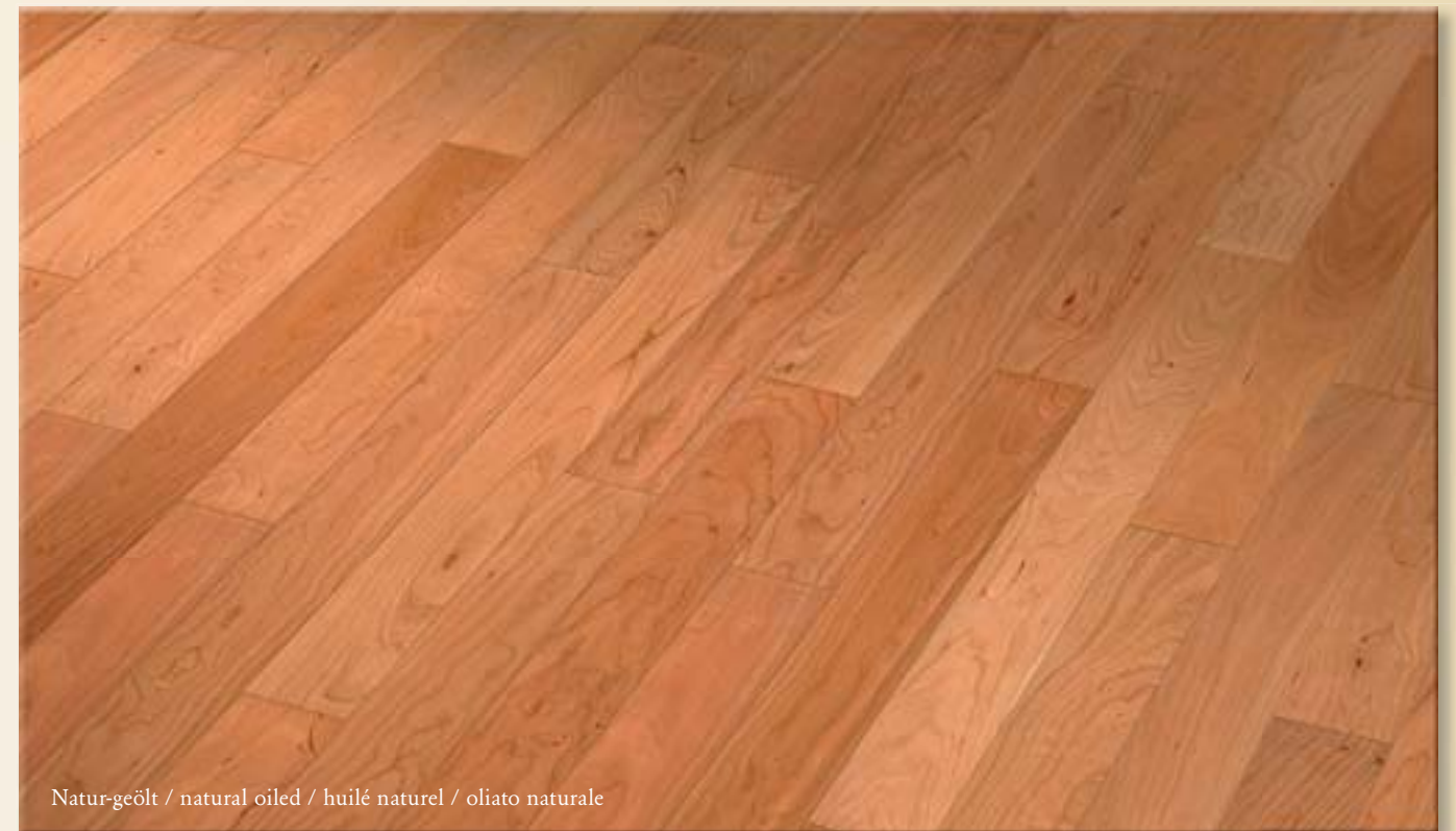
Natur-geölt / natural oiled / huilé naturel / oliato naturale

Oberfläche: natur-geölt / UV-geölt / matt-lackiert Finish: natural-oil / UV-oil / matt-lacquer Finition: huilée naturelle / huilée UV / vernis mat Finitura: oliata naturale / oliata UV / verniciata opaco